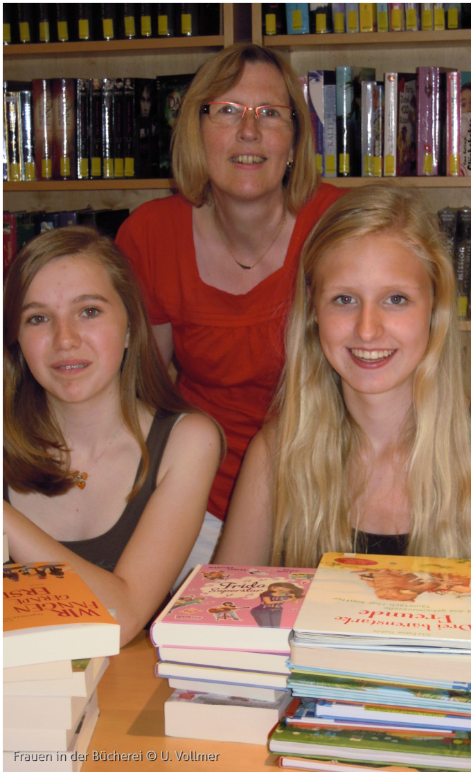
Frauen in der Bücherei

Ein Leben ohne Lesen ist möglich, aber sinnlos!